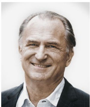
DR. HANSPETER FLURY PRÄSIDENT SLH

Trotz Ende der COVID-Pandemie stehen die Schweizer Spitäler weiterhin unter grossem wirtschaftlichem Druck. Dies einerseits wegen Rohstoffmangel und Teuerung ohne entsprechende Erhöhung der Tarife und andererseits durch massiven Druck auf das Zusatzversicherungssystem seitens der Finanzmarktaufsicht (FINMA).